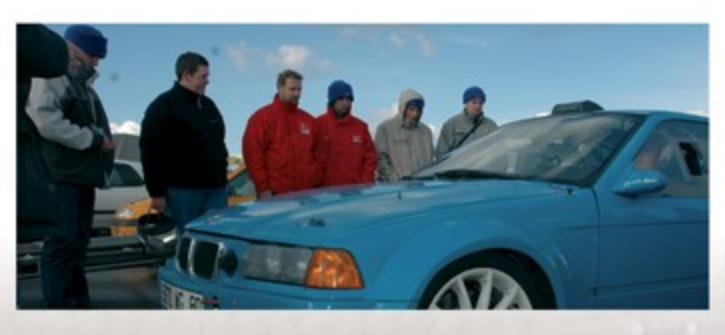
Le club des supporters Au fil des courses et aidé par la création de l'association, un groupe de passionnés se forme autour de notre équipe et nous retrouve sur chaque épreuve que ce soit pour le plaisir ou pour