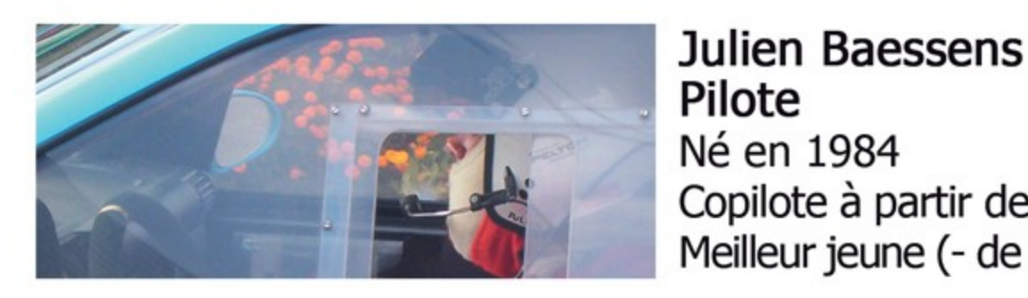
Pilote Né en 1984 Copilote à partir de 2000 puis pilote en 2003 jusqu'à aujourd'hui. Meilleur jeune (- de 25 ans) à la Finale de la Coupe de France 2006.